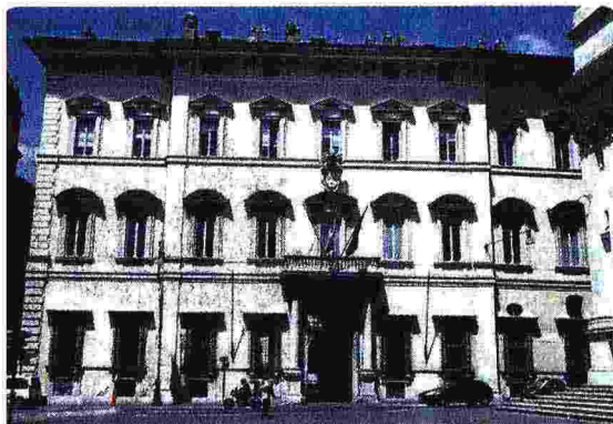
Sede di Finnat Fiduciaria

per le famiglie e gli imprenditori che affrontano temi spesso complessi come quello dell'emersione di attività estera, della pianificazione familiare e della conservazione del patrimonio.